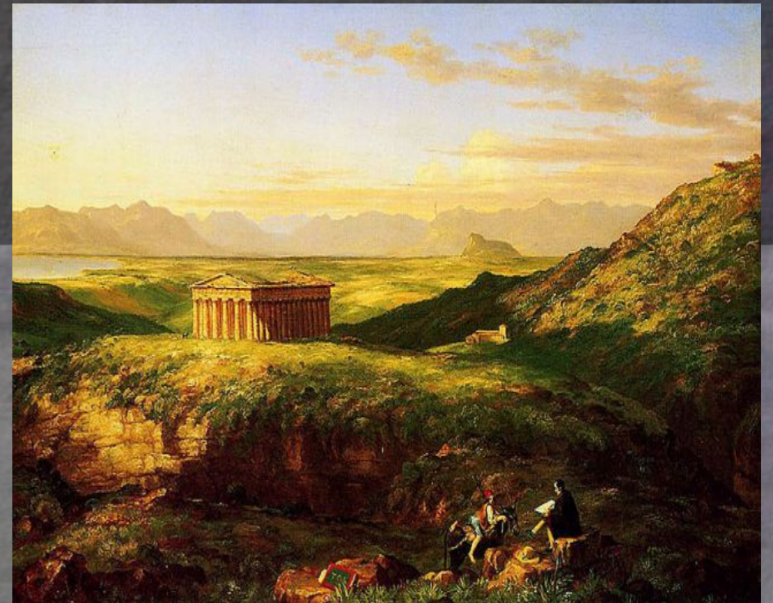
Thomas Cole, The Temple of Segesta (1843)

La fine della Repubblica partenopea (1799)